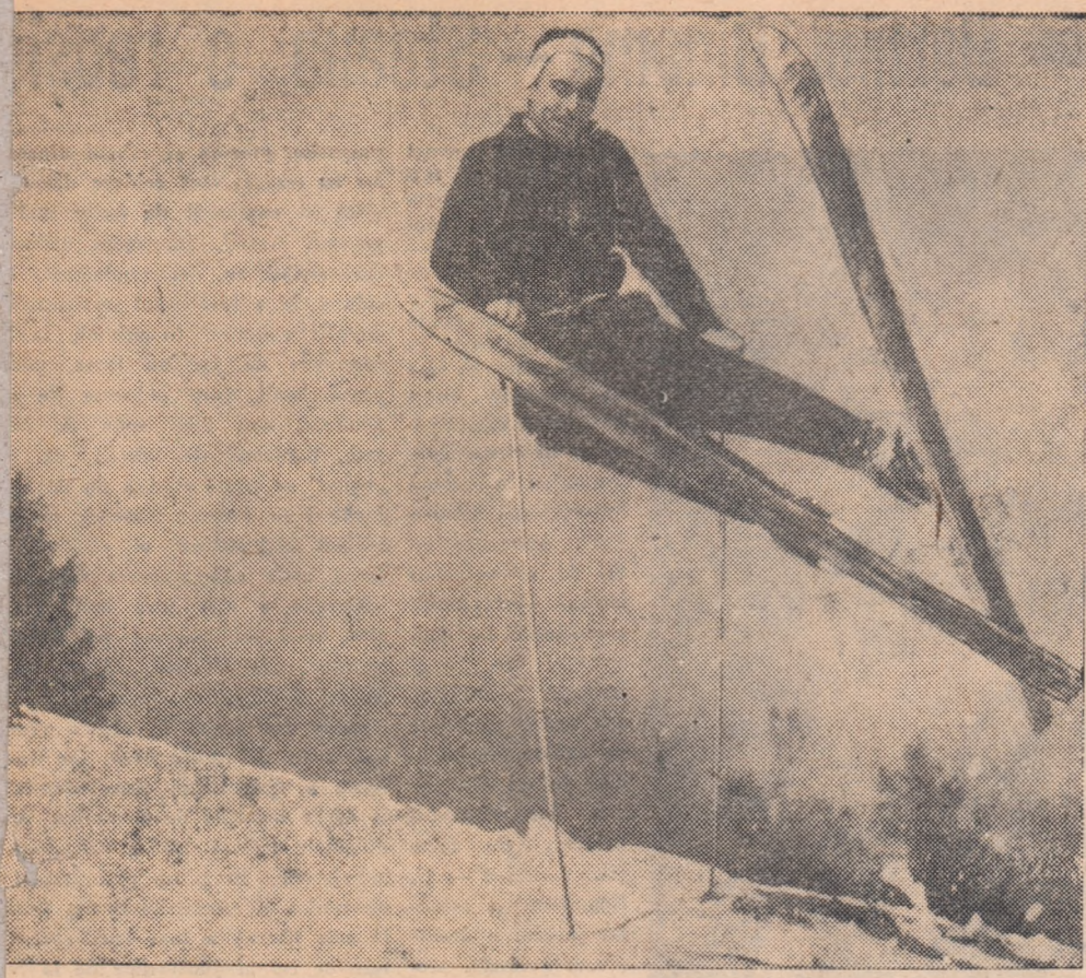
„Și în aer”