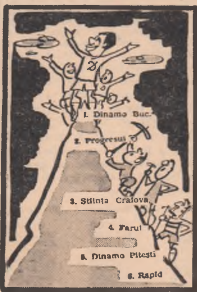
DINAMO: — De cînd n-am mai respirat noi aerul ăsta!