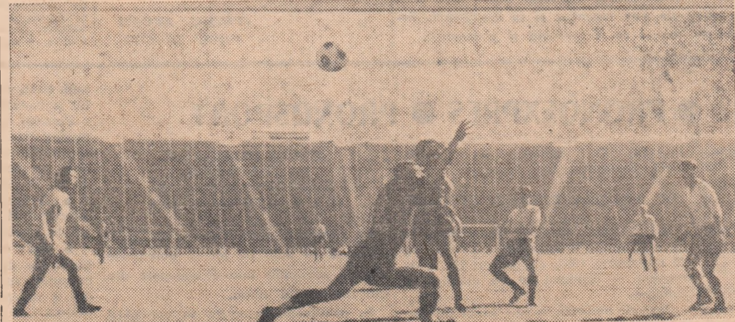
Unul dintre cele nouă goluri marcate de lotul olimpic în poarta echipei Sileska Nixsici.