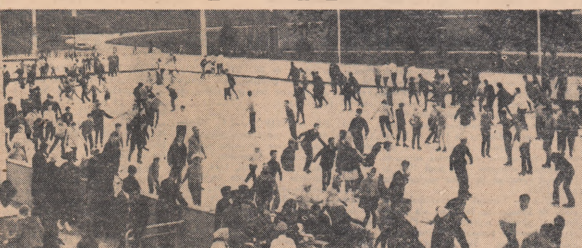
atinoarul Floreasca constituie, în aceste zile, din praful iernii, locul de întâlnire a nenumărați amatori de patinaj. Bine dotată, baza sportivă de la Floreasca oferă iubitorilor plăcute momente de distracție și recreere. În fotografie: un instantaneu surprins de fotoreporterul nostru, T. Roibu

19 NOIEMBRIE: ora 16,45: Ti- ara—Moscova (feminin), ora 17,45: vinia tineret—Franța, ora 19: S.S.—Iugoslavia; DUMINICA 20 EMBRIE: România—România ti- t, Franța—U.R.S.S.; LUNI 21 EMBRIE: România tineret—U.R.S.S., ania—Iugoslavia; MARȚI 22 EMBRIE: România tineret—Iugo- ia, România—Franța; MIERCURI NOIEMBRIE: Franța—Iugoslavia, ania—U.R.S.S.