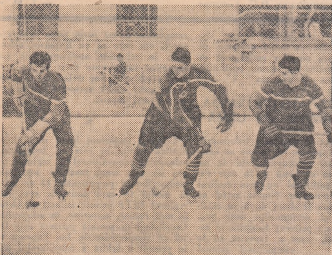
ASTĂZI, LA ORA 18, PE PATINOARUL „23 AUGUST”