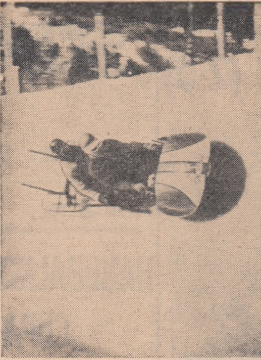
Echipajul Panțuru — Neagoe într-o coborâre pe pârta de la Sinaia