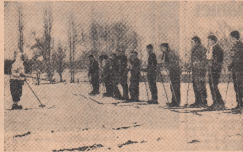
Din nou, la start. După un an de zile, iubitorii schiului se vor întrece din nou în sportul lor preferat. Prilejul cel mai bun: apropiatele concursuri de Spartachiadă de iarnă.

căminului cultural pentru șah, iar în holul școlii am instalat o masă de tenis. Deoarece vor fi — tinde seama de edițiile anterioare — mulți amatori de șah și tenis de masă, o parte dintre jucuri vor fi găzduite și de clubul din localitate.