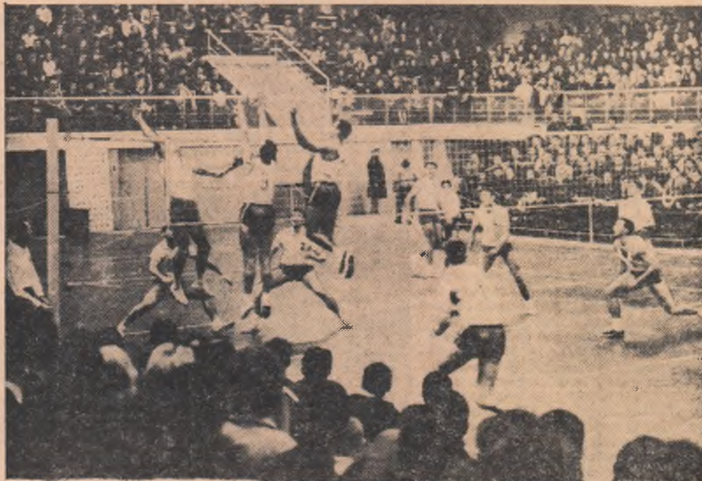
Blocajul rapidist respinge atacul echipei Dinamo