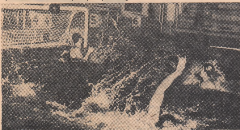
Aspect de la ultimul antrenament al dinamoviștilor bucureșteni

Un ultim amănunt despre jocul de duminică: conducerea partidei a fost încredințată arbitrului F.I.N.A., maghiarul J. Boer.