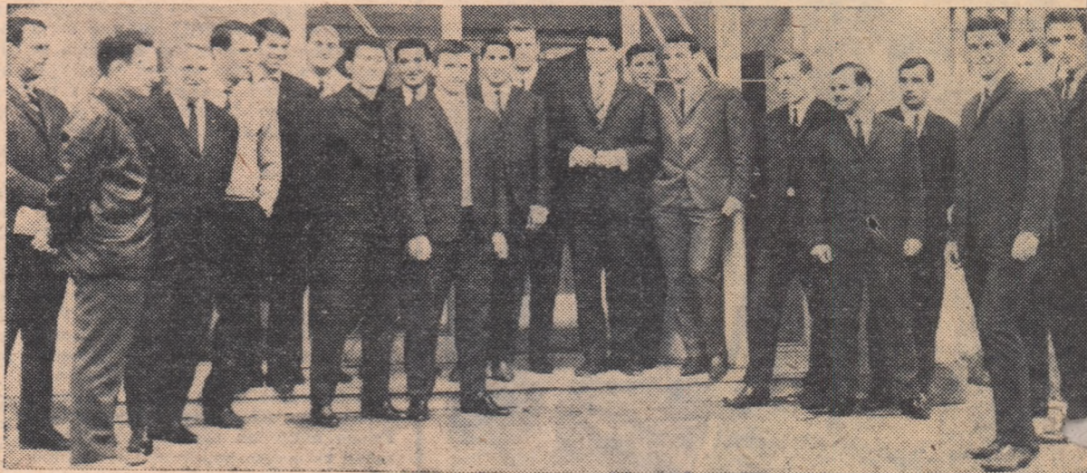
Lotul republican de fotbal înainte de plecarea în Italia

Prin telefon, de la trimisul nostru special, G. NICOLAESCU