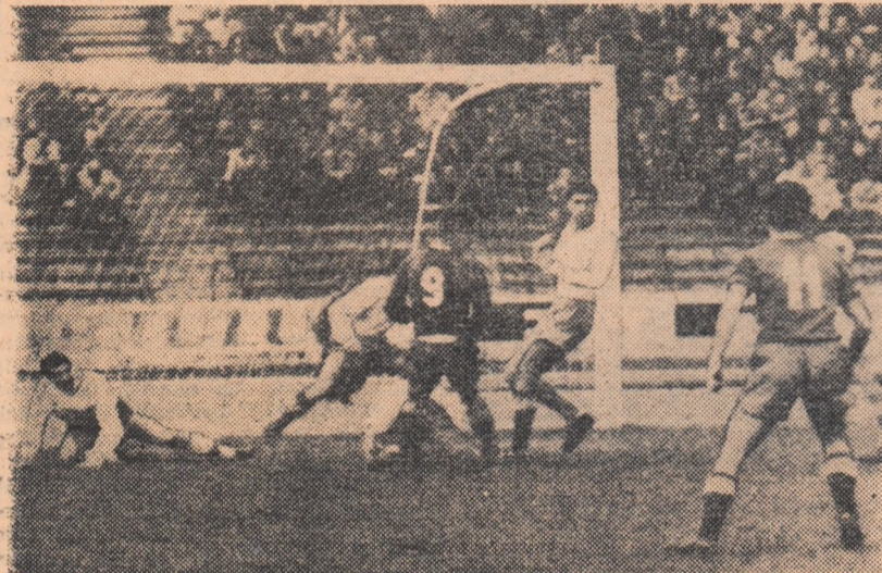
O fază dintr-un meci STEAUA-FARUL

Aceasta fiind situația, fiecare joc cîștigă în importanță și ne putem aștepta la meciuri dintre cele mai palpitante. De pildă, publicul bucureștean va asista pe „Republicii” la ultimul cuplaj al anului, un cuplaj de zile mari: RAPID-PETROLUL (ora 12,15) și, în continuare, STEAUA-FARUL. În ultimele trei campionate, Farul a cîștigat de trei ori în fața Stelei și a pierdut o singură dată, celelalte meciuri încheindu-se la egalitate, în timp ce Rapid are la activ patru victorii asupra Petrolului (pierzînd doar de două ori). Partide la fel de interesante au loc la Arad (U.T.A.—DINAMO BUCUREȘTI), Craiova (UNIVERSITATEA—ROGRESUL) și Cluj (UNIVERSITATEA—DINAMO PITESTI). Dar, iată programul complet al etapelor: ARAD: U.T.A. — Dinamo București PETROȘENI: Jiul — Politehnica Timișoara. BRĂȘOV: Steagul roșu — C.S.M.S. Iași CLUJ: Universitatea — Dinamo Pitești BUCUREȘTI: Steaua — Farul și Rapid — Petrolul CRAIOVA: Universitatea — Progresul București.