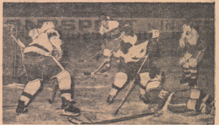
Atac la poarta echipei Politehnica. Fază din meciul de hochei Voința M. Ciuc — Politehnica București