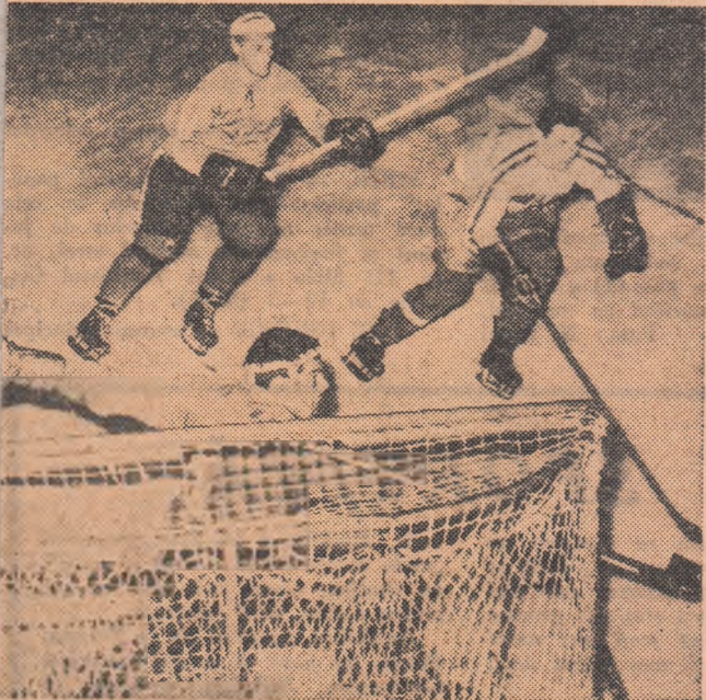
Un nou atac al echipei noastre respins cu dificultate de portarul italian