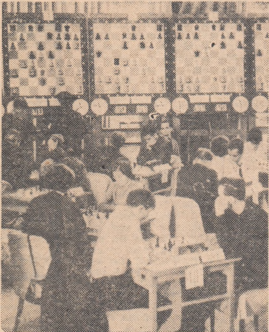
In timpul intalnirilor din al doilea tur