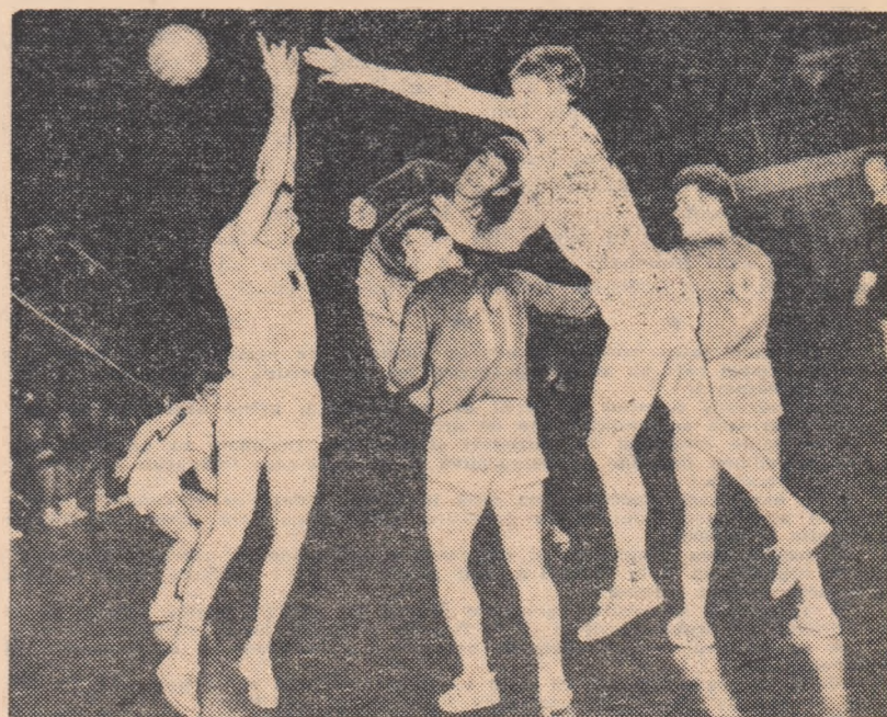
Fază din meciul România - R. F. Germană, două din cele mai puternice reprezentative masculine de handbal din lume.