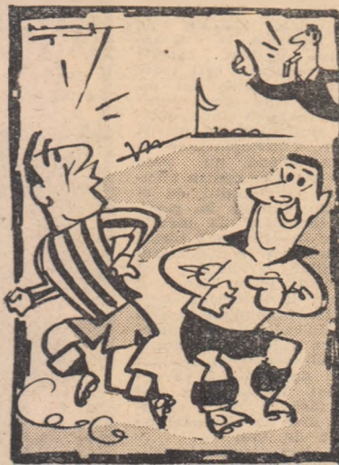
— Ai să rizi, dar n-a fost oisaid! Desen de Neagu Rădulescu

Zeană! A mai încărunit un pic pe la temple dar ochii îi sint iluminați de aceeași flăcără nestinsă a dragostei pentru fotbal. E antrenor la „copiii Politehnicii Timișoara”. A fost și la echipa-nții. Puțină vreme. Cum e obiceiul la... Timișoara. Acum, cu ochii antrenorului, privește ca spectator echipa pe care a antrenat-o. Și convorbirea are o plecare... ex abrupto.