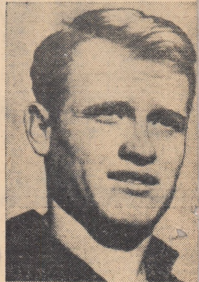
Takaci, extrema dreapta de la Vojvodina Novisad, este unul dintre cei mai valorosi jucatori ai campioanei Iugoslaviei. Miercuri, la Madrid, Vojvodina intilnește „C.C.E.” echipa Atletico