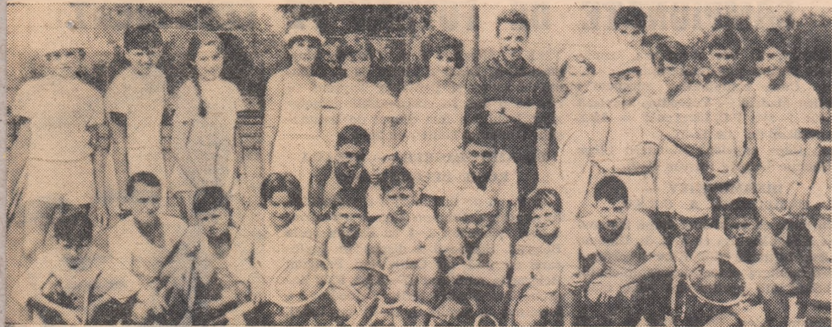
„Cursanții” taberei de tenis de la Hunedoara

Criteriile științifice de selecție elaborate de federații sunt aplicate cu succes către tot mai mulți antrenori.