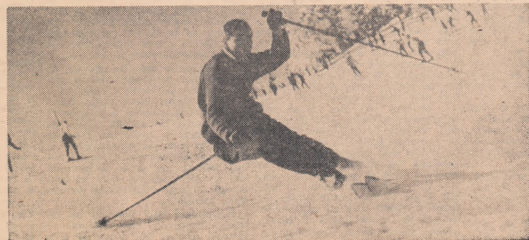
Primul antrenament pe zăpadă