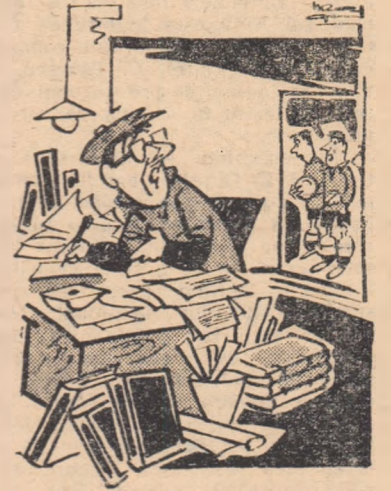
— Ce faci, maestre, nu mai termini tabelul ăla, că se întunecă...

Așadar, care este timpul pe care antrenorii îl afectează pregătirii pro-