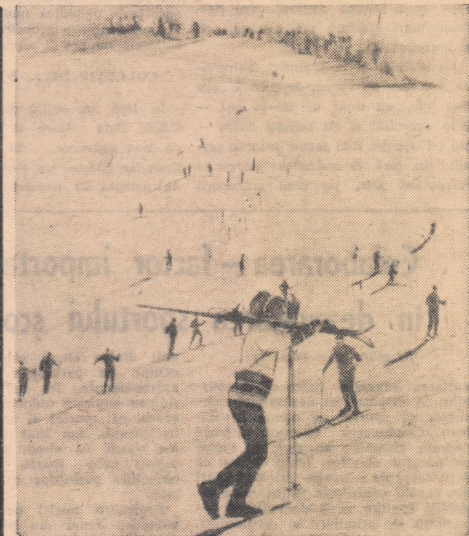
Pe pîrțile Postăvarului...