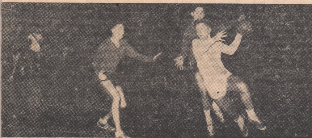
Fază din meciul Șc. sp. nr. 1 — Șc. sp. nr. 2, disputat ieri după amiază în sala Dinamo

La sfârșitul săptămânii trecute au continuat în întreaga țară jocurile din cadrul „Cupei Sportul popular”. Ca și până acum, partidele ce au avut loc cu acest prilej au fost vii disputate și au oferit spectatorilor întâlniri de calitate, cu o desfășurare interesantă.