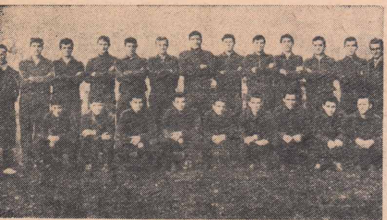
Jucătorii lotului de tineret

serie de greutate pentru tinerii noștri fotbaliști. — Adică? — Mai întâi, schimbarea de climă. Va trebui să suportăm aerul rarefiat al înălțimilor din Etiopia (2400 m altitudine la Adis Abeba). — Ce ne puteți spune despre jucătorii și echipele pe care le veți întâlni?