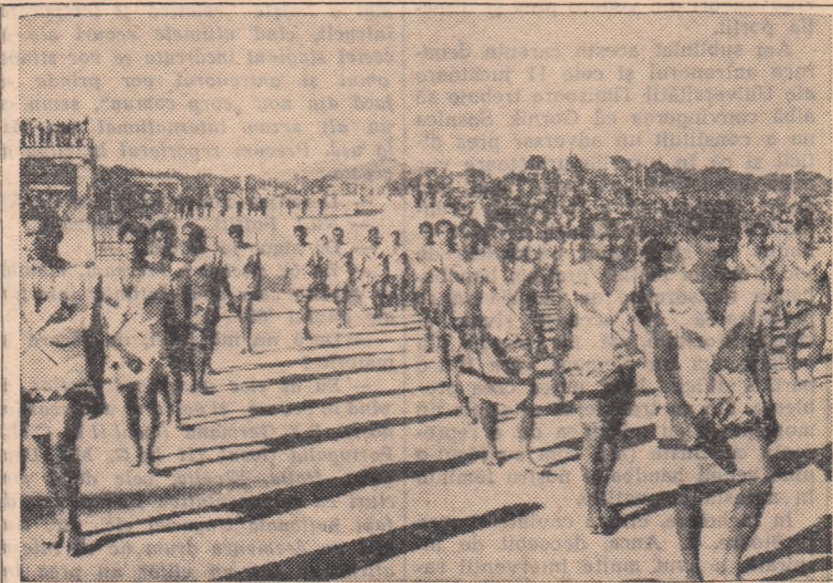
Aspect de la festivitatea de deschidere a Jocurilor Pacificului de Sud, care se desfășoară la Noumea (Noua Caledonie). La festivitate, în fața a 15000 de spectatori au deilat peste 1000 de sportivi participanți la cea de a II-a ediție a acestor Jocuri. În foto: dehlarea delegației insulelor Wallis și Futuna.

Ieri, în concursul de natație Marie Jose Kersaudy a câștigat patru probe: 100 m liber — 1:06,5; 100 m înot 1:18,0; 100 m spate 1:17,4; 400 m liber 5:05,0. Rezultatele nu sînt excepționale, dar trebuie remarcat faptul că această campioană din insulele Tahiti are numai... 12 ani și jumătate!