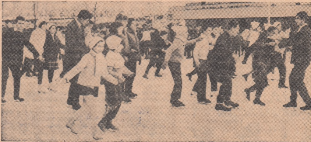
Printre activitățile recreative ce vor fi rezervate elevilor pe timpul vacanței de iarnă se află și sportul. Fîind vorba de sezonul alb, patinajul, schiul și sîniușul se vor afla

desigur în truntea preferințelor elevilor. Unii dintre ei au început, de pe acum, să se obișnuiască cu... luciul gheții.