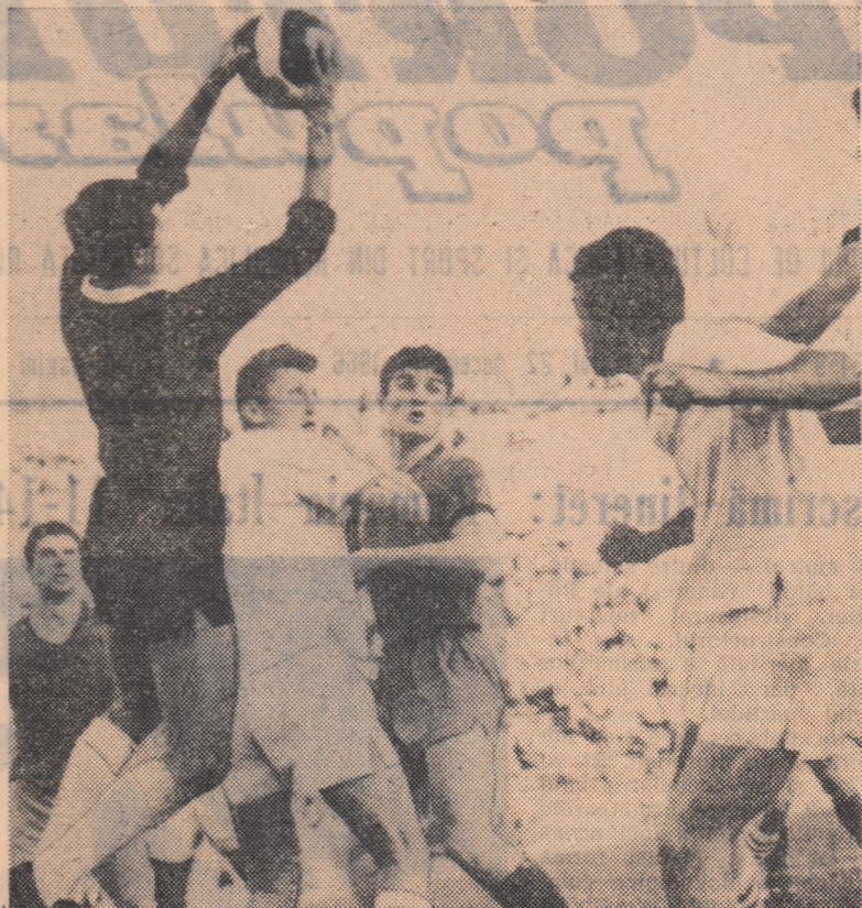
O amintire plăcută pentru U.T.A.: laza prinsă pe peliculă de fotoreporterul nostru Aurel Neagu, este din meciul Steaua — U.T.A., în care arădenii au câștigat cu 1—0.

— Da, e adevărat. U.T.A. a fost recunoscută ca una din echipele românești în care tehnica a fost in-