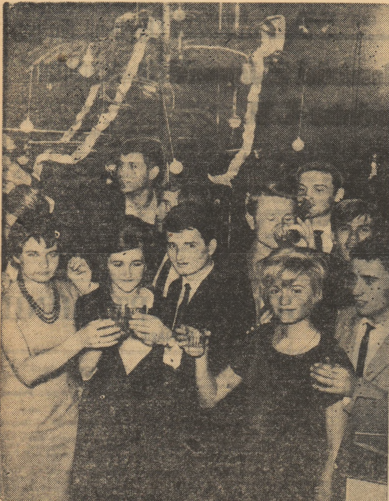
La Sovata, Revelionul tinerelor speranțe ale atletismului. Se ciocnește un pahar de vin (nu mai multe) pentru viitoarele succese, iar gîndul sare pe la un an, spre Mexic 1968.

Uzinele Grivița Roșie... La masa „sportivilor“ un tînar cu coif strălucitor pe cap cere un moment de liniște. I se a-