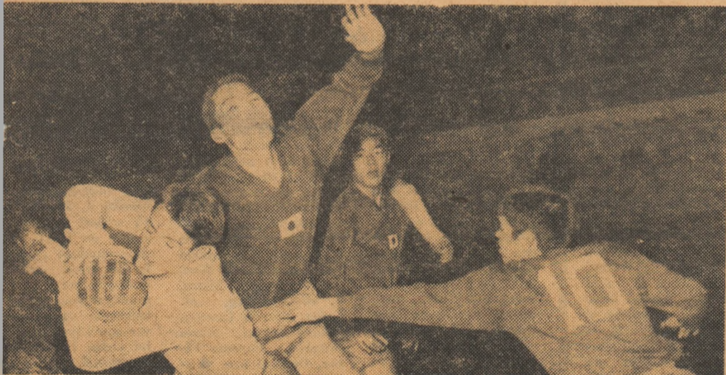
Costache II a depășit apărarea japoneză și va șuta la poartă. Fază din întâlnirea România-Japonia desfășurată marți în Capitală