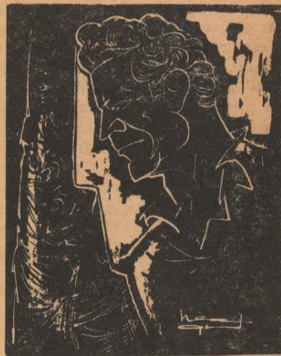
VIDA GHEZA văzut de Neagu Rădulescu