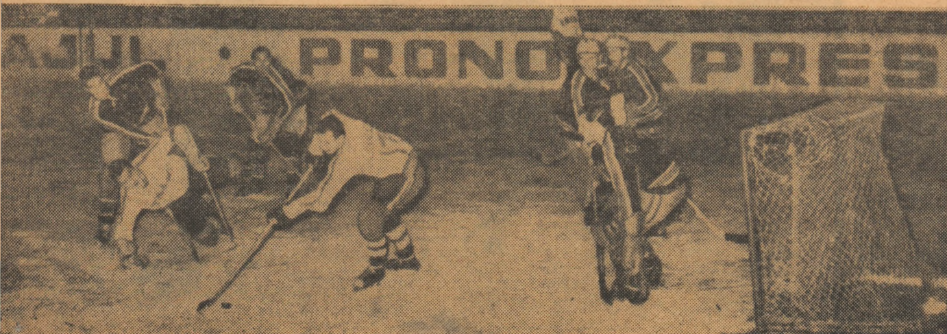
Aspect din meciul Dinamo București-Tirneava Odorhei, desfășurat în noiembrie anul trecut pe patinoarul „23 August” din București