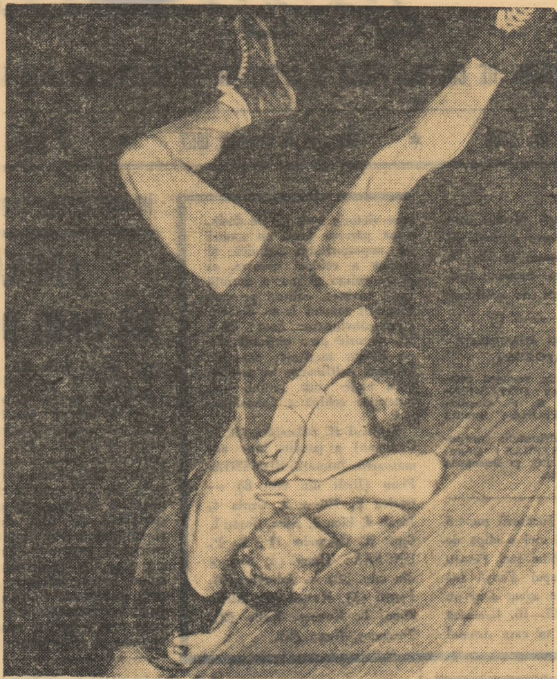
În finalizarea unui procedeu cu deosebită eficacitate: aruncarea peste șold din lateral

Confruntările internaționale din 1966 ale tinerilor noștri luptători — turneele „Speranțelor olimpice” și „Panglica albastră”, întâlnirile bilaterale cu echipele reprezentative de juniori ale R.F. Germane și R.S.S. Bielorusse etc. — au prilejuit o serie de concluzii îmbucurătoare. Evoluția acestor luptători a fost în multe cazuri promițătoare. Mulți dintre tinerii au dovedit o bună orientare și o mare labilitate tactică, au trecut cu ușurință de la atac la apărarea oportună sau la contraatac, au folosit execuții tehnice bine pregătite, îndeosebi dezchilibrările și mișcările înșelătoare executate în mare viteză și cu multă forță.