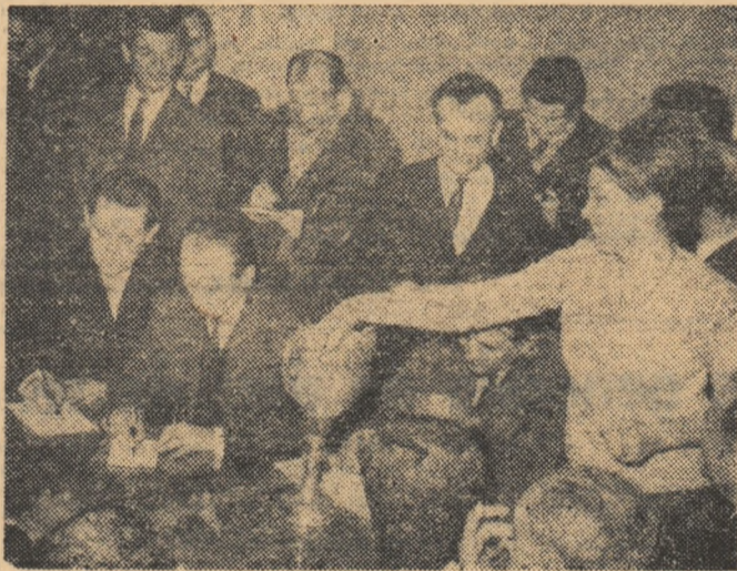
A început tragerea la sorți...