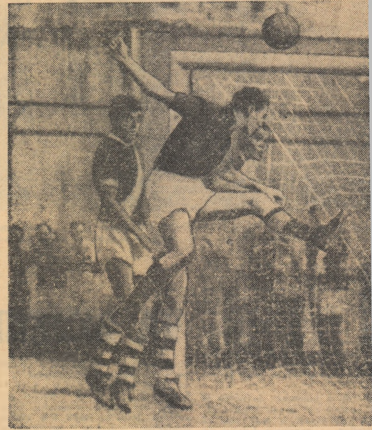
După cum am anunțat, fotbalistul maghiar Florian Albert a fost invitat de Flamengo pentru cîteva săptămîni în Brazilia. Recent, el a jucat în formația Flamengo și a înscris un gol (după cum se vede în fotografie) în partida cu da Gama (2-0)