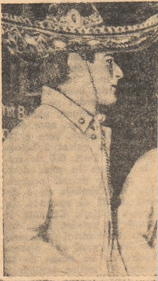
Trei mexicani? Nu! Doar pe elvețieni!