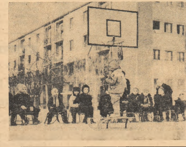
Pe locuri, își gata, start II Peste câteva clipe, sâniulele vor porni pe derdeluş. Instanţaneu obişnuit în cartierul Ferentari din Capitală