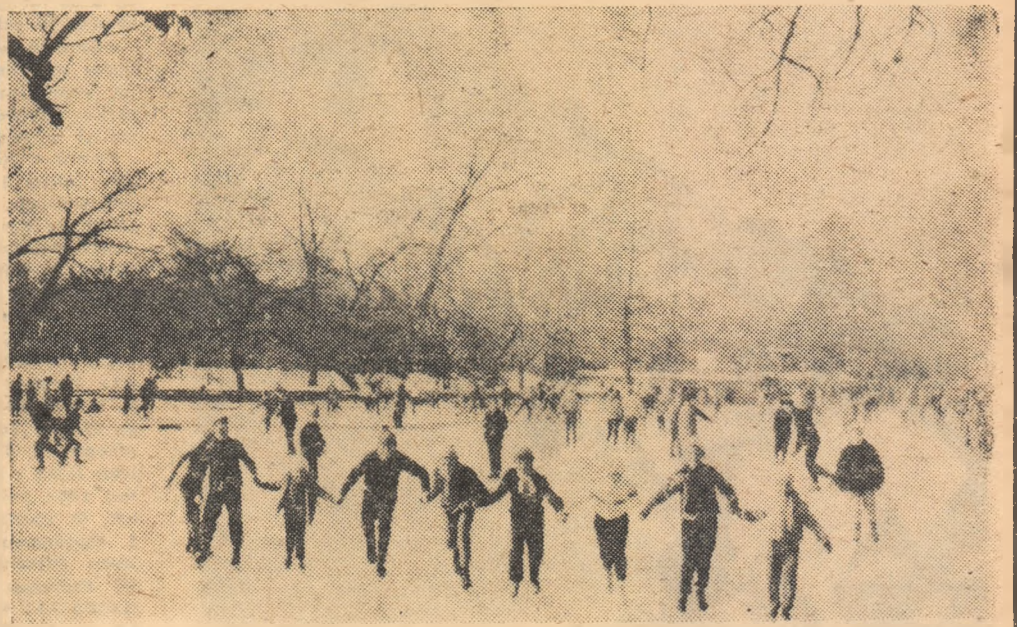
De ieri se patinează în Cismigiu. Fotoreporterul nostru, T. Roibu, a surprins această „horă” a veseliei pe gheață