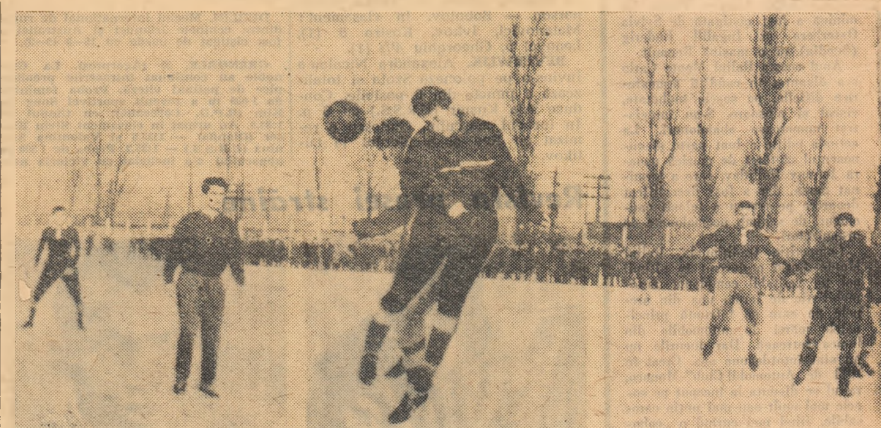
Din nou la fotbal! Duminică, la Giulești, la meciul Rapid—Tehnometal

Introducerea de jocuri complimentare, cum ar fi handbalul și basche-