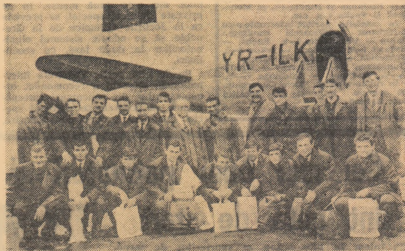
Lotul de tineret de fotbal la sosirea pe aeroportul Băneasa.

Reprezentanta minerilor din Valea Jiului își începe turneul în Albania la 10 februarie. Turneul petroșenilor durează 10 zile.