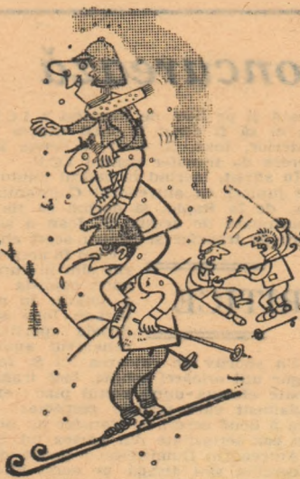
La schi, e-n floare hărmlăta și după îndelung asalt poți face schi și la Sinaia, Dar numai la nivel... înalt!

La Sinaia, cooperativa Prestarea ține la dispoziția oamenilor veniți la odihnă numai patru perechi de schiuri folosibile.