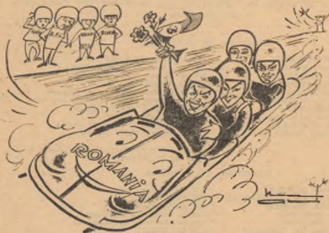
Iute ca săgeata... desen de NEAGU RĂDULESCU

● FACEȚI CUNOȘTINȚA CU CEI PATRU CAMPIONI ● BOBUL VICTORIOS A FOST CONSTRUIT ÎN ÎNTREGIME ÎN ȚARA ● „ECHIPAJUL ROMÂNESC — „SPAIMA” CELOR MAI RENUMIȚI BOBERI DE PE CONTINENT” (U.P.I.) ● ȘI ACUM — „MONDIALELE”