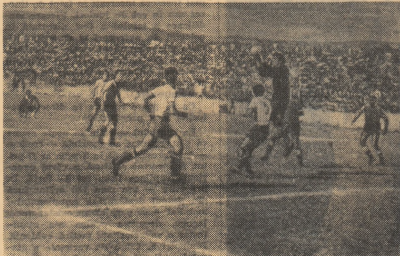
Fază de la unul din meciurile susținute în Gabon de fotbaliștii români (Urmare din pag. 1)

sportive, care au culminat cu întîlnirea internațională de fotbal.