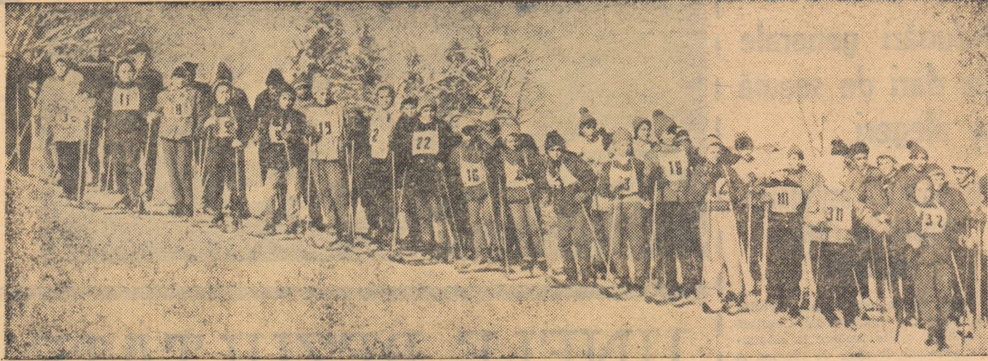
„Gata de start!“ Numărul copiilor și școlărilor care deprind tainele alunecării pe schiuri crește neîncetat în toată țara.

Campionatul categoriei A la fete va începe tot la 12 februarie și va avea o desfășurare normală pînă la etapa a XVI-a, inclusiv, după care va urma o întrerupere de două săptămîni. Campionatul va fi reluat la 9 aprilie, iar ultima etapă se va disputa la 16 aprilie. Întreruperea dintre 27 martie — 9 aprilie va fi folosită pen-