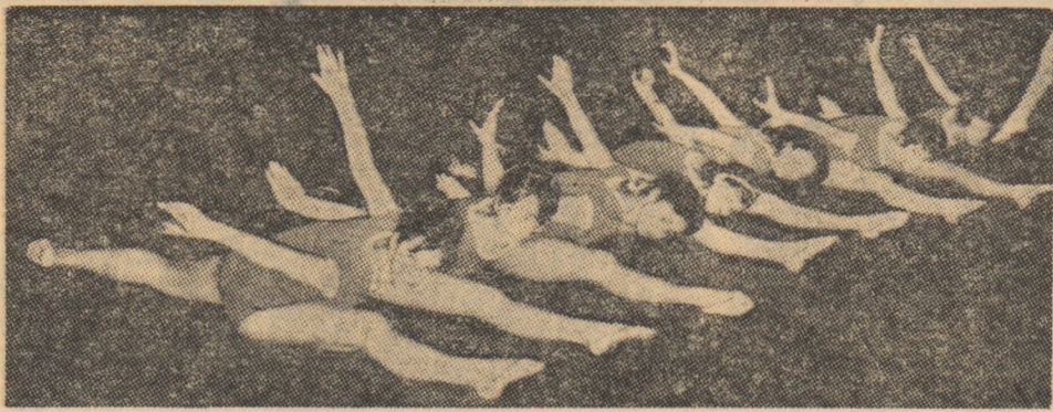
Orele de gimnastică desfășurate în cadrul Liceului nr. 35 din Capitală coincid adesea cu veritabile secvențe de balet, cum se poate vedea și în fotografia noastră...

Am desprins ca principală concluzie sublinierea critică a rănirilor în urmă și dorința unanimă a participanților la adunarea generală de a ridica activitatea asociației și progresul la nivelul celorlalte ramuri de sport. Urcul este pe deplin posibil. Credem că, pentru început, trebuie aplicate operativ importante propuneri care au încheiat ezbaterele adunării generale.