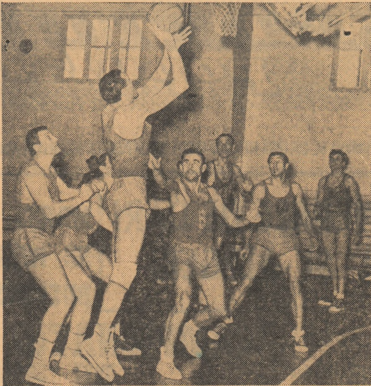
„Cupa 16 Februarie” va lua sfârșit o dată cu jocurile care se vor disputa în ziua de miercuri 8 februarie, în sala Giulești, începând de la orele 16,30.