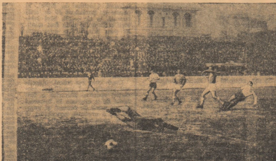
Ene II (Dinamo București), deschide scorul în meciul cu Steagul roșu