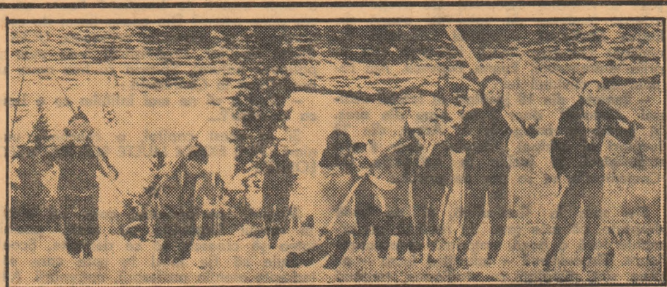
În aceste zile, centrele de învățare a schiului sînt în plină activitate. Cel mai dotat dintre copii se pregătește cu asiduitate pentru Concursul republican care se va desfășura în ziua de 5 martie. În fotografie, aspect din activitatea centrului de la Borșa: după o coborîre, copiii urcă din nou spre locul de plecare