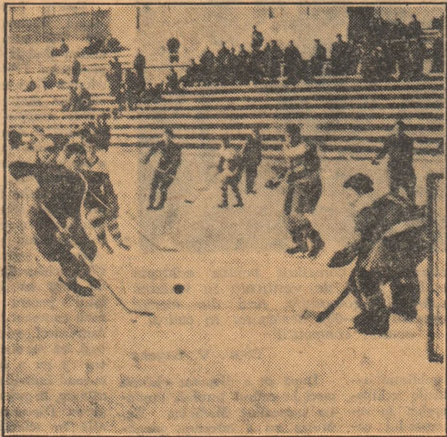
Ștefanov (Steaua) ratează o bună ocazie de a înscrie

AZI: ora 9: Steaua-Tîrnava; ora 17: Avîntul-Agronomia; ora 19: Dinamo-Politehnica