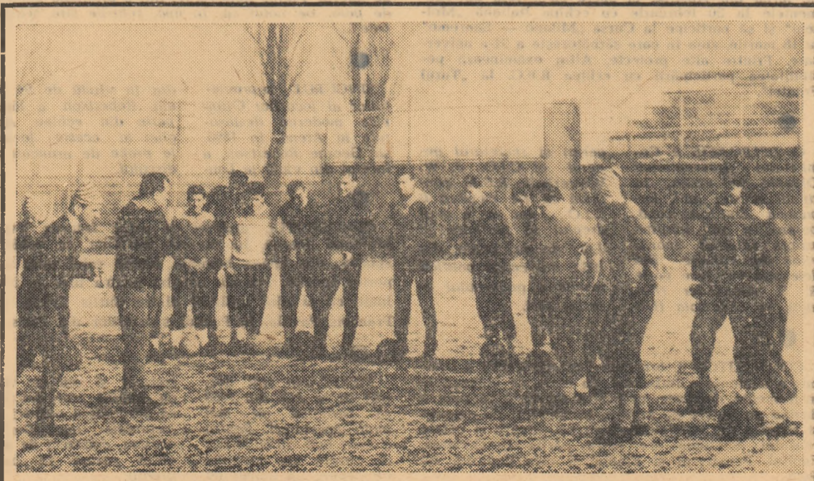
Fotbaliștii de la Rapid își continuă, cu regularitate, pregătirile pe terenul lor din Giulești, lătă-i ascultând indicațiile antrenorilor, gata să înceapă o nouă lecție de antrenament.

● CELE DOUĂ MECIURI Inter — Real din sferturile de finală ale „Cupei campionilor europeni” vor fi conduse de doi dintre cei mai buni conducători de joc din Europa: I. Zsolt (Ungaria) va arbitra partida de la Milano (15.II), iar G. Dienst (Elveția), cel care a condus finala C.M.—1966, va arbitra meciul de la Madrid (1.III). Este probabil ca al treilea meci (în cazul cind primele două se termină la egalitate) să se dispute la Marsilia, la 8 martie.