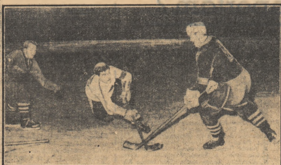
Un nou gol înscris în poarta Tinavei Odorhei

Echipele orașelor Sarajevo și Zagreb cuprind numeroși handbaliști și handbaliste de valoare, cunoscuți pe plan internațional. Ele sînt așteptate să seosească în Capitală în cursul dimineții de astăzi.