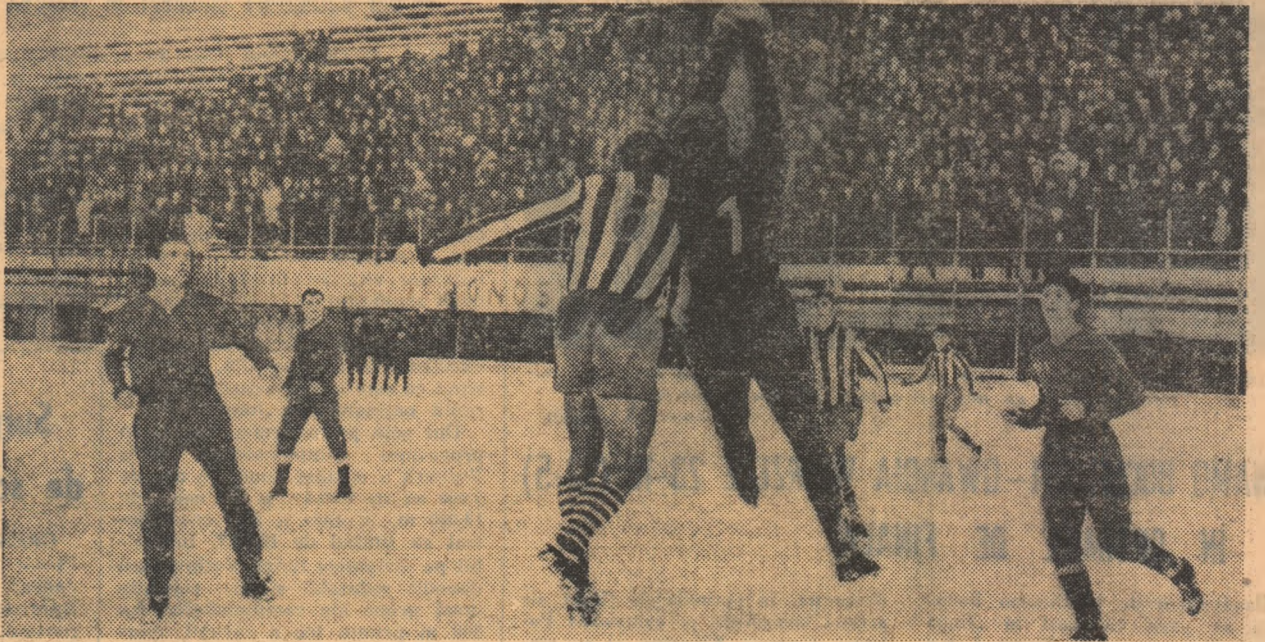
Fază din meciul Rapid — Dinamo (1-1)