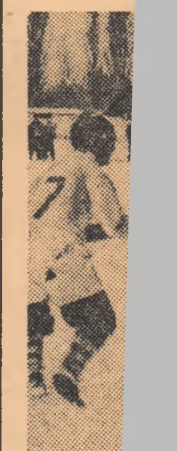
O repuner gului său structurilor).