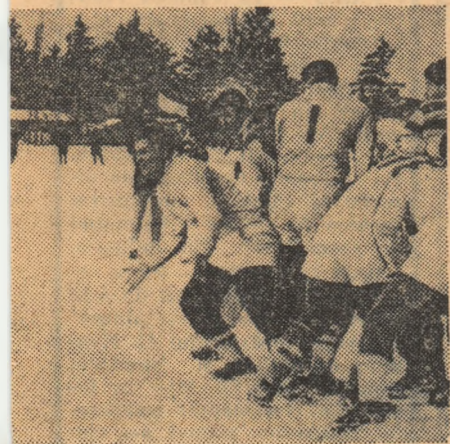
upă o „grămadă“: Irimescu „trimite“ cole- reanu (fază din meciul Grivita Roșie—Con-