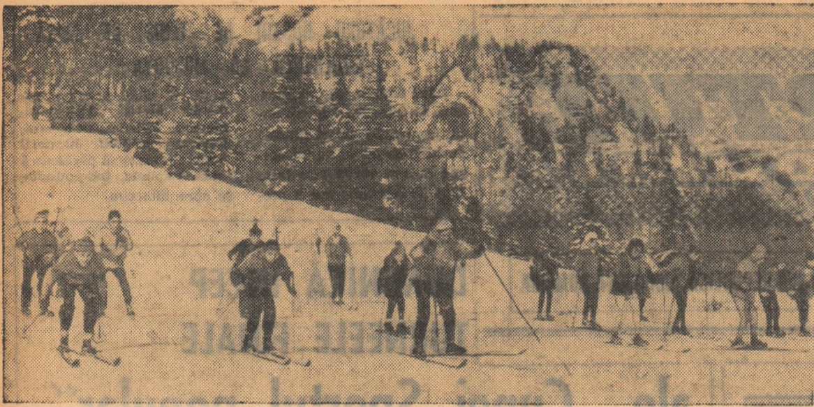
Lecție de schi la Poiana Stinilor