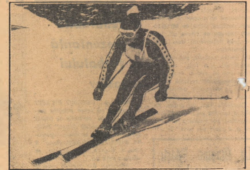
Șchioara canadiană Nancy Greene s-a dovedit, în actualul sezon, o specialistă a probelor de coborîre și slalom uriaș. Ea a cucerit lauri în câteva mari întreceri, desfășurate pe pîrțile din America și Europa. Fotografia de față a fost luată cu prilejul concursului internațional feminin de la Grindelwald, la care reprezentanta Canadei a ocupat primul loc în cursa slalomului uriaș.

STOCKHOLM, 15 (Agenții C.M. de tenis de masă, care se vor desfășura la Stockholm între 11 și 21 aprilie au primit din partea federației internaționale clasamentele în baza cărora — la 4 martie — vor fi trase la sorție pezele pentru cupele „Swaythling” și „Corbillon”. În clasamentul masculin, pe primul loc figurează echipa R. P. Chineze, urmată de Japonia, R.P.D. Coreeană, Suedia, U.R.S.S., Iugoslavia, Cehoslovacia, România, Anglia, R.F. a Germaniei, Ungaria, Coreea de sud etc. La feminin, ordinea este următoarea: R.P. Chineză, Japonia, Ungaria, U.R.S.S., Cehoslovacia, Anglia, România, R.F. a Germaniei, R.D. Germană, Iugoslavia, Polonia, Suedia etc.