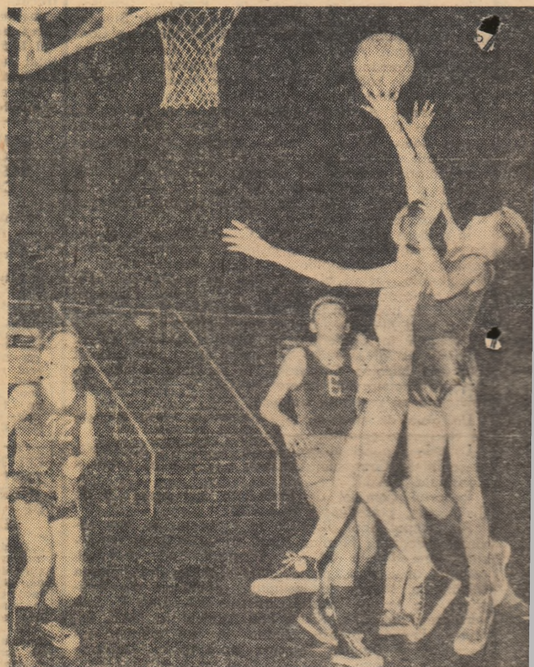
Luptă pentru balon între micuții baschetbaliști din Pitești