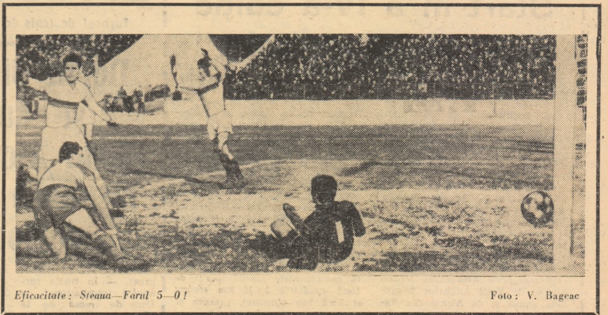
Eficacitate: Steaua — Farul 5-0!

În fine, contraatacul se poate baza pe conducerea individuală a mingii de către un jucător, conducător de joc care traversează cu rapiditate un mare spațiu de teren, pătrunde pe locul „minimei rezistențe” în apă-