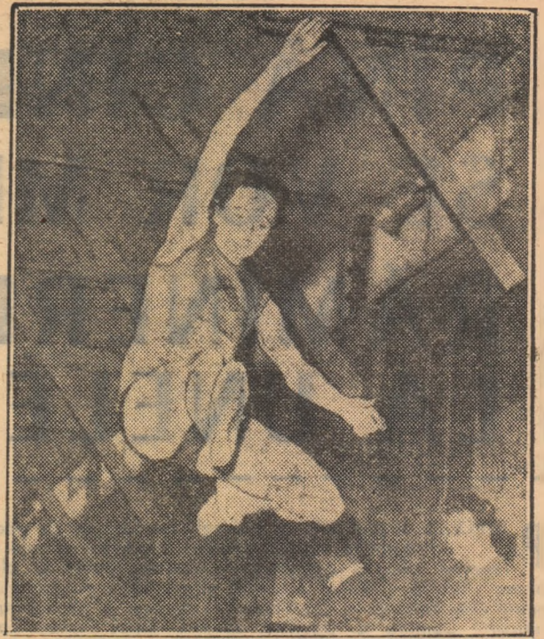
Viorica Viscopoleanu în timpul săriturii record (6,13 m)

Jocul de azi va fi condus de arbitrii Al. Kostic și B. Ivanovic din R.S.F. Iugoslavia.