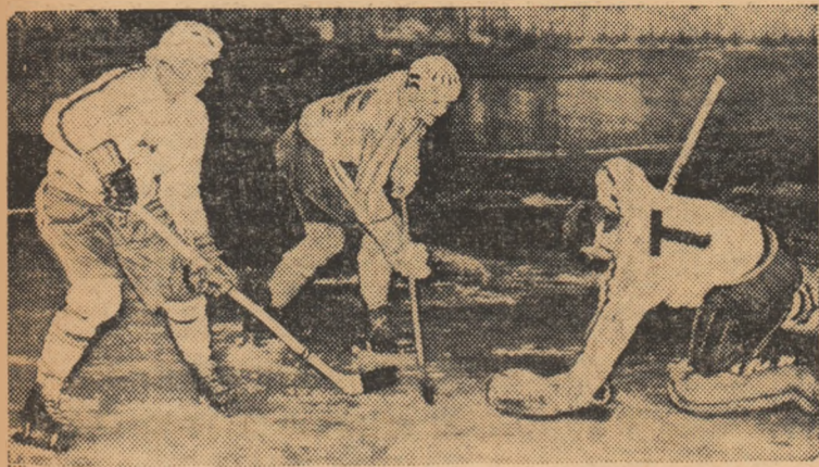
Pană ratează o nouă ocazie