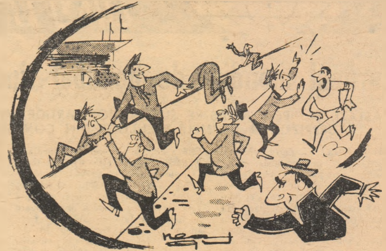
— Lasă-i, nene, sînt suporterii noștri! Desen de Neagu Rădulescu