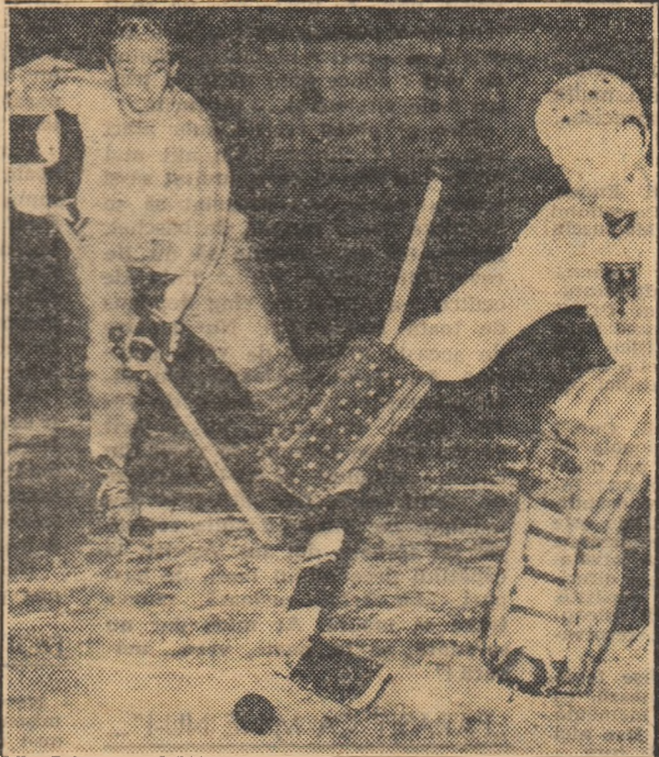
Fază din meciul România — R.F.G. (6-2) disputat recent pe patinoarul „23 August”