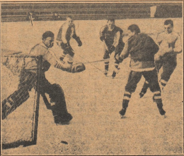
Hocheiștii cehoslovaci la antrenament.

În cursul zilei de ieri jucătorii celor două formații au participat la ultimele lecții de antrenament înaintea partidelor. Antrenorii noștri, M. Flamaropol, N. Zografi și I. Tiron, au lucrat cu fiecare