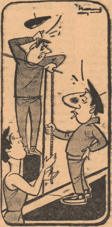
Ei și ce altă caz pentru cîțiva centimetri...