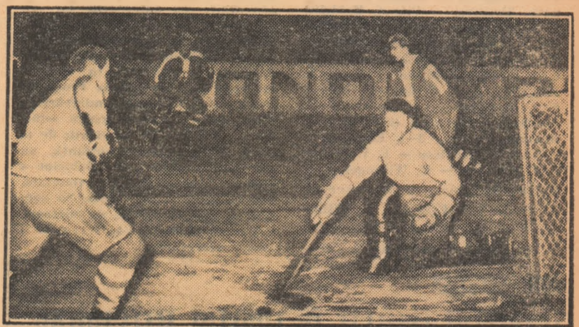
Atac al echipei bucureștene la poarta oaspeților.