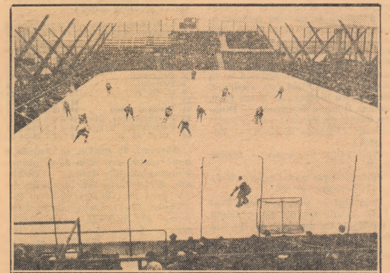
Patinoarul „Wiener Stadthalle”, gazda întrecerilor din grupa A a C.M. de hochei. Aici se va disputa și meciul România — Austria, la 27 martie 1967