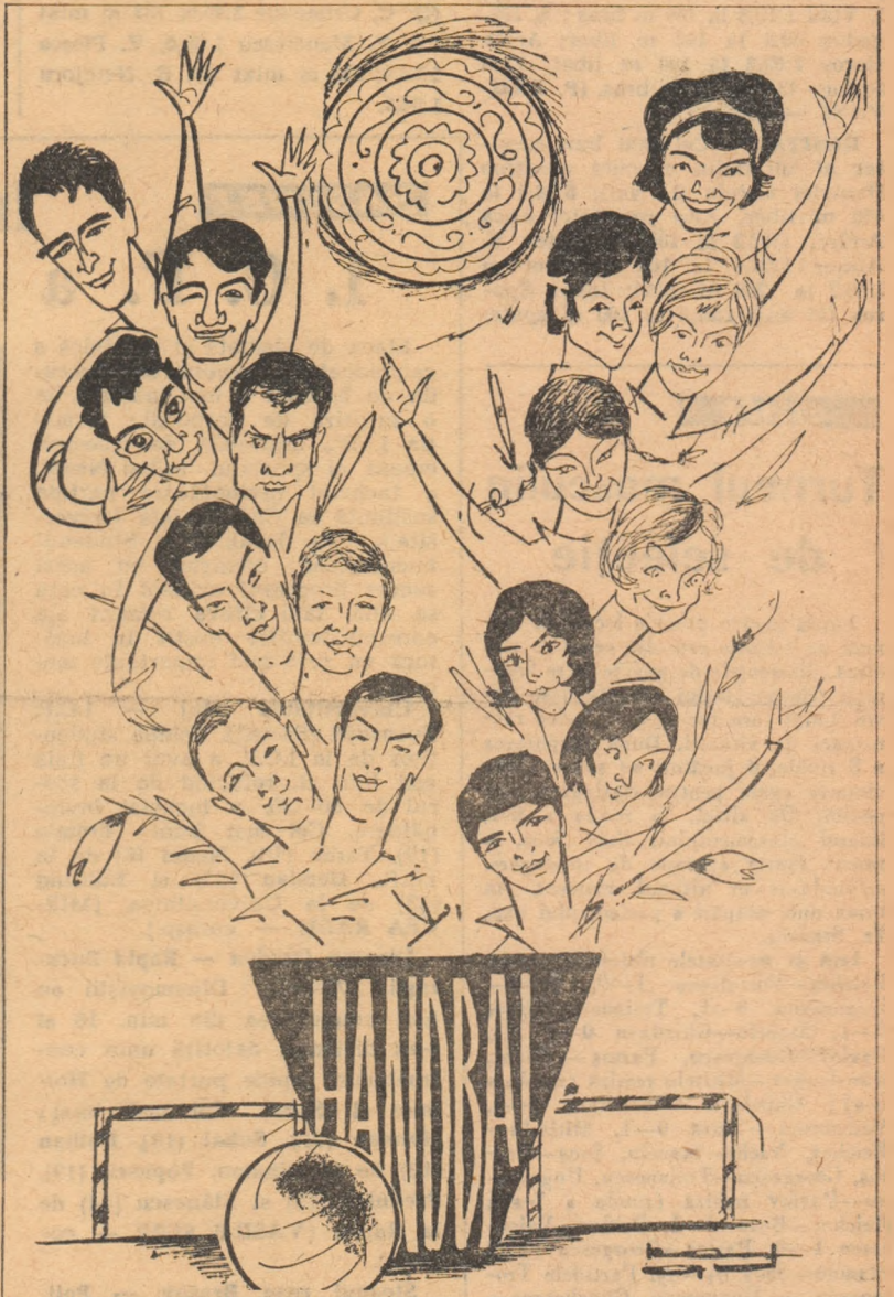
Primăvara handbalului nostru

Astăzi după-amiază, la ora 17,40, echipele noastre reprezentative de handbal, câștigătoare ale turneului mondial de tineret din Olanda se inapoiază în Capitală, venind — pe calea aerului — de la Copenhaga.