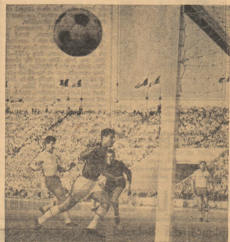
Gol? Nu. Balonul a trecut milimetric pe lângă bară. A fost una din cele mai electrizante faze oferite de jucătorii echipelor Steaua și Dinamo într-un meci disputat în sezonul trecut.

Anul 1967 are „semne bune”. Le dorim din ce în ce mai bune, pentru că ciclismul românesc are nevoie de o reabilitare în fața suporterilor lui, pentru că rutierii trebuie să reintre în „plutonul” celor mai buni sportivi ai țării, pentru că lor, cicliștilor, le-au fost create toate condițiile ca la Jocurile Olimpice de la Ciudad de Mexico să realizeze o performanță valoroasă!