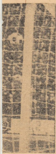
megea șutată de