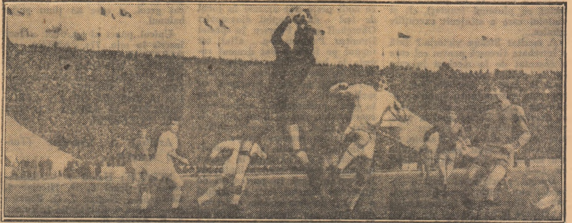
Haidu prinde cu siguranță un balon „înalt”, dominând întregul cercul. (Fază din meciul Steaua — Dinamo București)