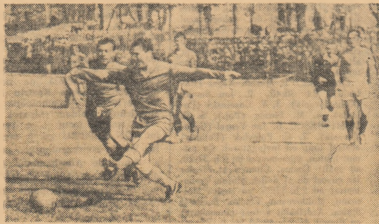
Ciornovă, intrat în careul Oltului Rm. Vilcea, centrează și Păiș va înscrie cel de al patrulea gol pentru Politehnica

Au înscris: Olteanu (min. 19), Meder (min. 46), Negustoru (min.