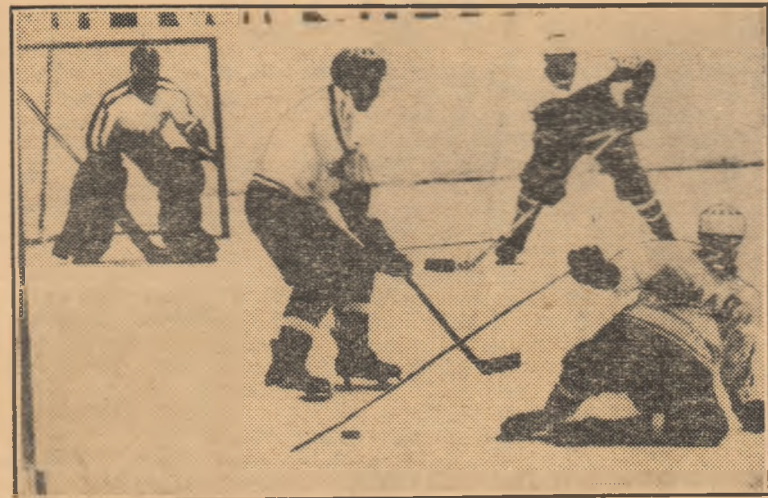
Fază din meciul România — Austria.

Rezultate din grupa A: R.D.G. — R.F.G. 8-1 (2-0, 3-0, 3-1), disputat duminică seara, Cehoslovacia — Suedia 5-5 (4-2, 0-1, 1-2), U.R.S.S. — Canada 2-1 (0-1, 1-0, 1-0). Ca urmare a acestui rezultat echipa Uniunii Sovietice a acumulat 12 puncte și este virtuală campioană mondială și europeană.