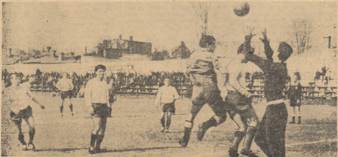
Înaintași bucureșteni în ofensivă (Fază din meciul Flacăra roșie București—Stuful Tulcea).

Rubrică redactată de Administrația de stat Loto-Pronosport.