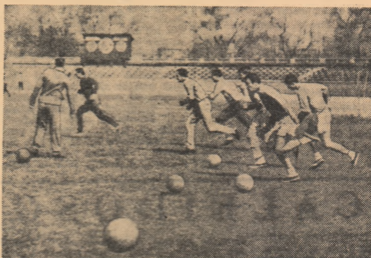
Instantaneu de la antrenamentul de ieri al dinamoviștilor bucureșteni