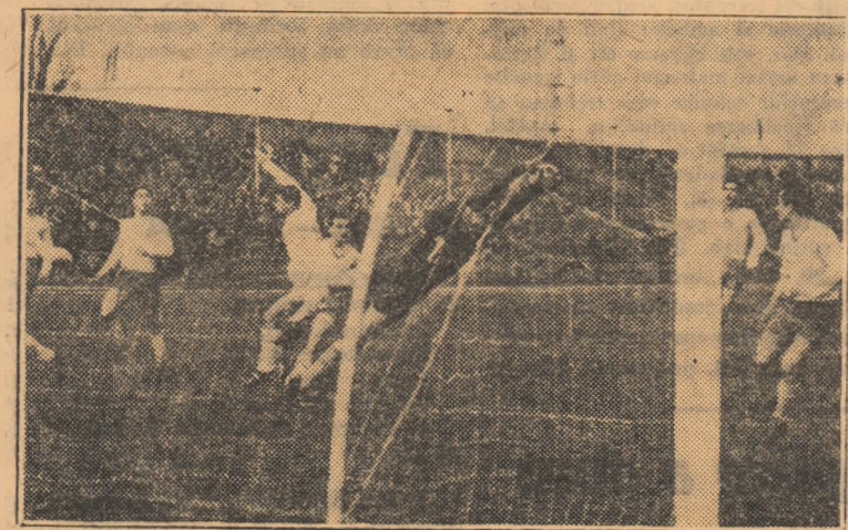
Etapă viitoare (9 aprilie)

Petrolul — Farul U.T.A. — C.S.M.S. Politehnica Timișoara — Progresul Steagul roșu — Dinamo București Universitatea Craiova — Universitatea Cluj Steaua — Dinamo Pitești Rapid — Jiul