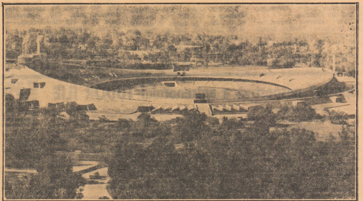
Stadionul din „Ciudad Universitaria” cu 80.000 de icuri care va găzdui întreceri de atletism și de fotbal din cadrul J. O.