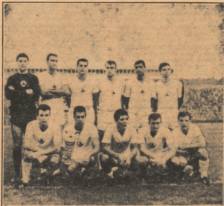
Iată echipa Slavia Sofia, care în „Cupa cupelor” a eliminat formația Servette Geneva cu scorul general de 3—1 (3—0 și 0—1).

2:18,2, 2. Z. Giurasa 2:18,5 — nou rec. republican, 3. Barlay (Ung.) 2:22,6; 100 m delfin (m): 1. Kuridza 61,1, 2. Mladosici (Iug.) 64,2, ...5. A. Băin 65,8; 200 m delfin (m): 1. Aurisch (R.D.G.) 2:21,1, 2. Mladosici 2:24,7, ...4. Băin 2:25,6; 100 m bras (m): 1. Wissiak (Austria) 1:09,7, 2. P. Teodorescu 1:12,2 — nou rec. republican de juniori mic, 3. Tomici (Iug.) 1:13,0; 200 m bras (m): 1. Wissiak 2:37,4, 2. P. Teodorescu 2:38,3; 200 m mixt (m): 1. Vrhovsek 2:22,3 — record, 4x100 m mixt (m): Sel. română (Giurasa 64,4, Teodorescu 1:12,8, Băin 65,3, Demetriad 56,5) 4:19,0; 100 m liber (f): 1. A. Boban (Iug.) 63,3; 400 m liber (f): 1. M. Roenisch (R.D.G.) 4:55,7, 2. H. Zeier (Iug.) 4:58,8, ...4. D. Coroiu (a concurat bolnav) 5:21,7.