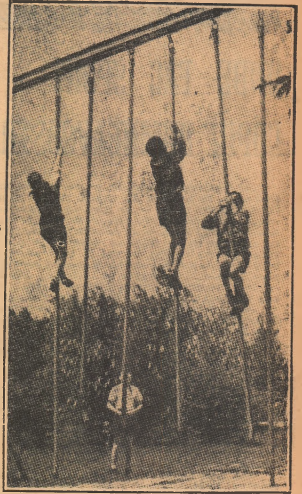
Concurs ad-hoc de îndeminare și forță. E primăvară, cald, soare și parcurile bucureștene sînt pline de copii amatori de sport

ORGAN AL UNIUNII DE CULTURĂ FIZICĂ ȘI SPORT DIN REPUBLICA SOCIALISTĂ ROMÂNIA