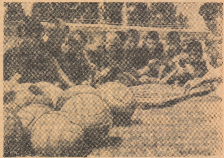
Ședință de... tactică la echipa de copii a asociației Dunărea Giurgiu