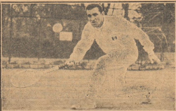
Ion Tiriac la primul antrenament pe terenurile de la Progresul