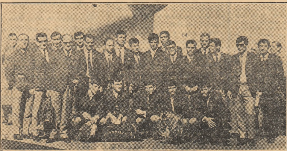
Fotbaliștii ciprioți — cinci minute după aterizarea avionului, pe aeroportul Băneasa

Joi după amiază, o cursă specială a adus pe aeroportul Băneasa echipa reprezentativă a Ciprului. Oaspeții au fost salutați, la sosire, de reprezentanți ai