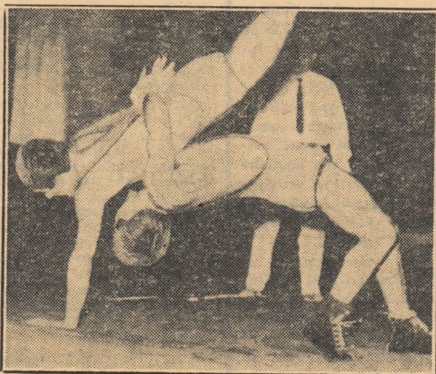
Un spectaculos salt, specific luptelor greco-romane. Asemenea procedee, mult gustate de public, ca și altele vom vedea la finala care începe azi în sala Floreasca.