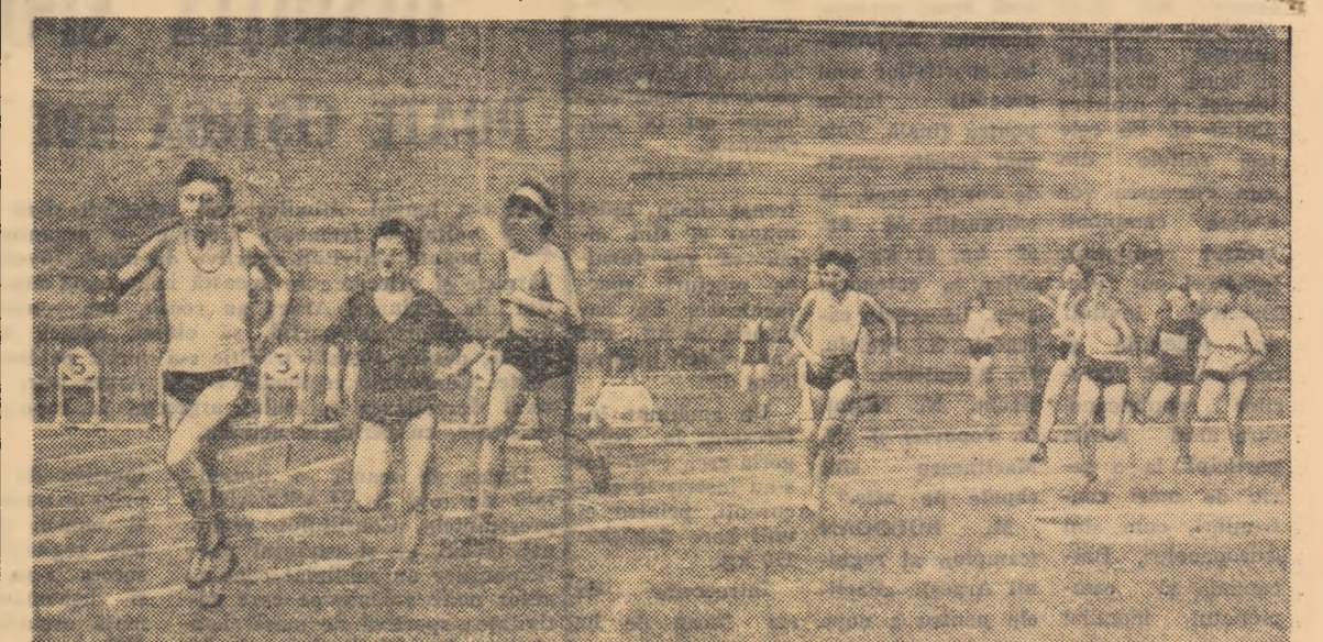
Aspect dintr-un concurs desfășurat recent pe stadionul Republicii din Capitală

Meciuri în cadrul campionatului de juniori (XV): Gloria-Gr. Roșie I 3-3, Cl. sp. șc. I-Steaua 19-3, Constructorul-Rapid 3-0 (neprezentare), Șc. sp. 2-Olimpia 6-5, Gr. Roșie II-Cl. sp. șc. II 9-0. Juniori în 8: Cl. sp. șc. I-Steaua 9-6, Olimpia-Șc. sp. 2 21-15, Progresul-Dinamo 3-0, Constructorul-Rapid 3-0, Gr. Roșie I-Gloria 3-0, Cl. sp. șc. II-Gr. Roșie II 3-0. (În ultimele trei meciuri s-a dat cîștig de cauză primelor echipe prin neprezentarea adversarilor respectivi).