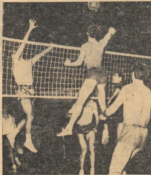
Fază din meci: atacă jucătorii de la Steaua

sitatea Buc. 1-3 (11, -8, -7, -9); Știința Petroșeni — Politehnica Iași 3-0 (4, 8, 3). FEMININ. Categoria B — Seria I: Drapelul roșu Sibiu — Liceul N. Bălcescu Cluj 3-0 (4, 9, 0); Tricotajul Brașov — Corvinul Deva 3-1 (9, -6, 9, 12); Sănătatea Arad — Viltorul Buc. 3-0 (13, 9, 12); Sănătatea Tîrgoviște — Progresul Buc. 1-3 (-15, -13, 13, -3); Seria a II-a: Universitatea Iași — I.S.E. Buc. 3-1 (3, -16, 3, 5); Politehnica Brașov — Medicina Buc. 1-3 (9, -8, -6, -6); Pedagogic Pitești — Medicina Tg. Mureș 3-1 (-14, 13, 12, 12); Universitatea Timișoara — Medicina Cluj 3-0 (3, 11, 6); Universitatea Buc. — Politehnica Galați 3-0.