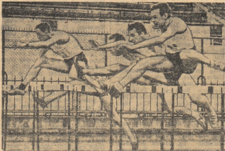
Aspect din finala probei de 110 metri garduri

Unul din cele șapte goluri: Varnavas a sărit disperat, dar n-a putut opri balonul