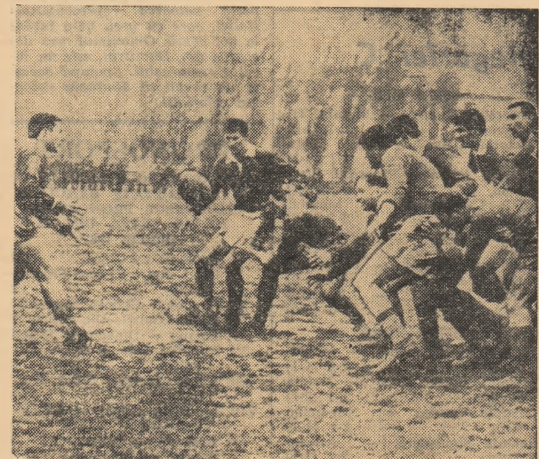
Imagine din timpul trialului