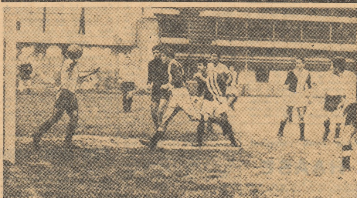
Fază din meciul Rapid C. F. București — I.M.U. Medgidia (1-1), disputat duminică în Capitală