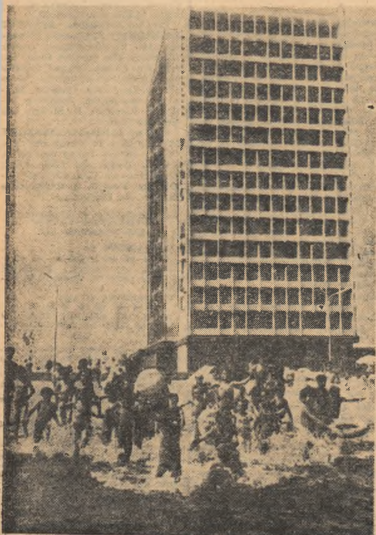
Onoare, apă, sport, iată ce oferă litoralul celor ce vor să-și petreacă concediul și vacanța în această zonă a țării