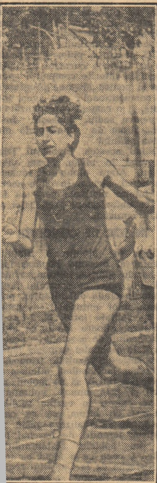
la Bădescu (Rapid București) a zătat zilele trecute un nou record blican de junioare la 400 m: s. Ea va participa la meciul mo—I.C.F.—Rapid, din cadrul primei etape

lei a țării la seniori. El se va disputa în zilele de 16—20 mai, la București, cu participarea echipelor care vor încheia pe primele 6 locuri în clasament returul întrecerii din categoria A.