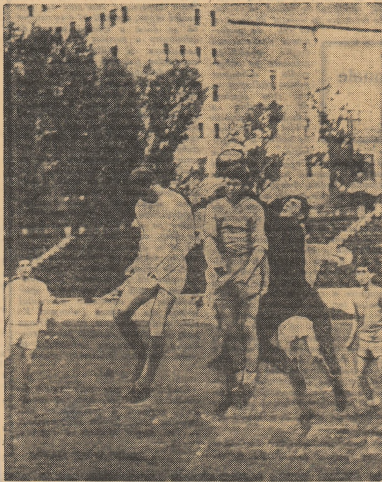
Dinamo București acordă toată atenția pregătirilor dinaintea meciului cu Politehnica Timișoara. Ieri, pe terenul din șos. Ștefan cel Mare dinamoviștii s-au antrenat în compania formației Dinamo Obor. În fotografie, fază la poarta oborenilor.

Rubrică redactată de Administrația de stat Loto-Pronosport.