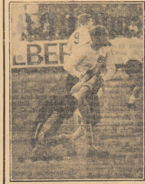
Fotbal, rugbi sau... lupte? Greu de descifrat această fază curioasă în care extremul sting al echipei suedeze Hammarby, celebrul „Nacka” Skoglund, pare să fi suportat un placaj din partea adversarului sau direct Lennartson de la Orebro. Skoglund, care a activat mai mult ani în Italia, este probabil obișnuit însă cu asemenea maniere „categorice” de a fi oprit în atac.

UN om de afaceri japonez cumpără în momentul de față din Brazilia materiale pentru fotbal. El duce, de asemenea, tratative cu câteva cluburi braziliene pentru a sustine meciuri demonstrative în țara sa. Japonia imită Statele Unite, intenționînd să creeze o ligă profesionistă de fotbal.