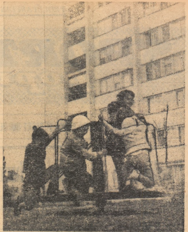
Loc de joacă pentru copii pe magistrala Nord-Sud.

REDACTORUL: Da, este o sugestie pe care o transmiterem pe această cale clubului sportiv raional Constructo-