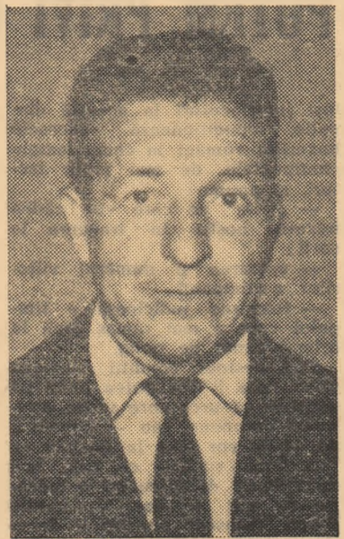
pe voi! Eliminați dintre voi pe aceia care sînt incorecți, pentru că sînt dușmanii fotbalului, ai voștri.

Închînd, aș vrea să mă adresez acelor tineri din echipele de categorie inferioară care vesează o zi în care să asculte, în poziție de drepti, imnul patriei noastre, pe stadionul „23 August“ sau pe un alt mare stadion al lumii: dacă vreti ca visul vostru să se împlinească, băieți, jucați fotbal, căutați cu acest sport atît de frumos — să nu mai aibă nici o toină pentru voi. Este singurul drum care duce spre deplina consacrare! Iar dacă, într-o zi sau alta, gustați din cupa amară a înfrîngerii, gîndiți-vă că poate veni alta în care victorios puteți fi voi! Respectați-vă adversarul pentru că și el să vă respecte