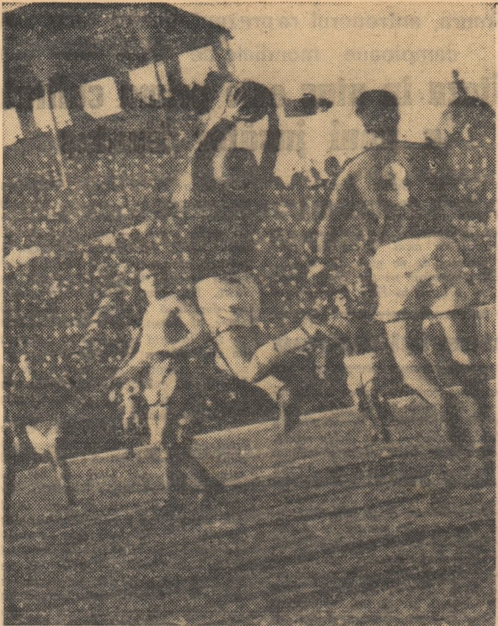
Popa, portarul timișorean, retine sigur balonul. (Fază din meciul Petrolul—Politehnica Timișoara).