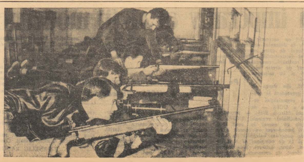
Zilnic la Poligonul Tineretului au loc antrenamente de tir atît dimineața cît și după-amiază. Aici vin cu regularitate zeci și sute de tineri și tinere din diferite asociații și cluburi sportive ale Capitalei.